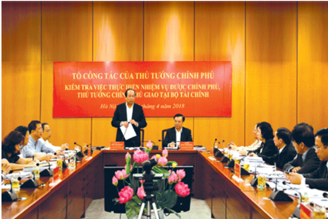
Bộ trưởng Mai Tiến Dũng phát biểu kết luận tại buổi làm việc với Bộ Tài chính.

Chiều 6/4/2018, Tổ công tác của Thủ tướng Chính phủ đã có cuộc làm việc tại Bộ Tài chính về nội dung kiểm tra việc thực hiện nhiệm vụ được Chính phủ, Thủ tướng Chính phủ giao và việc rà soát, cắt giảm các điều kiện kinh doanh.