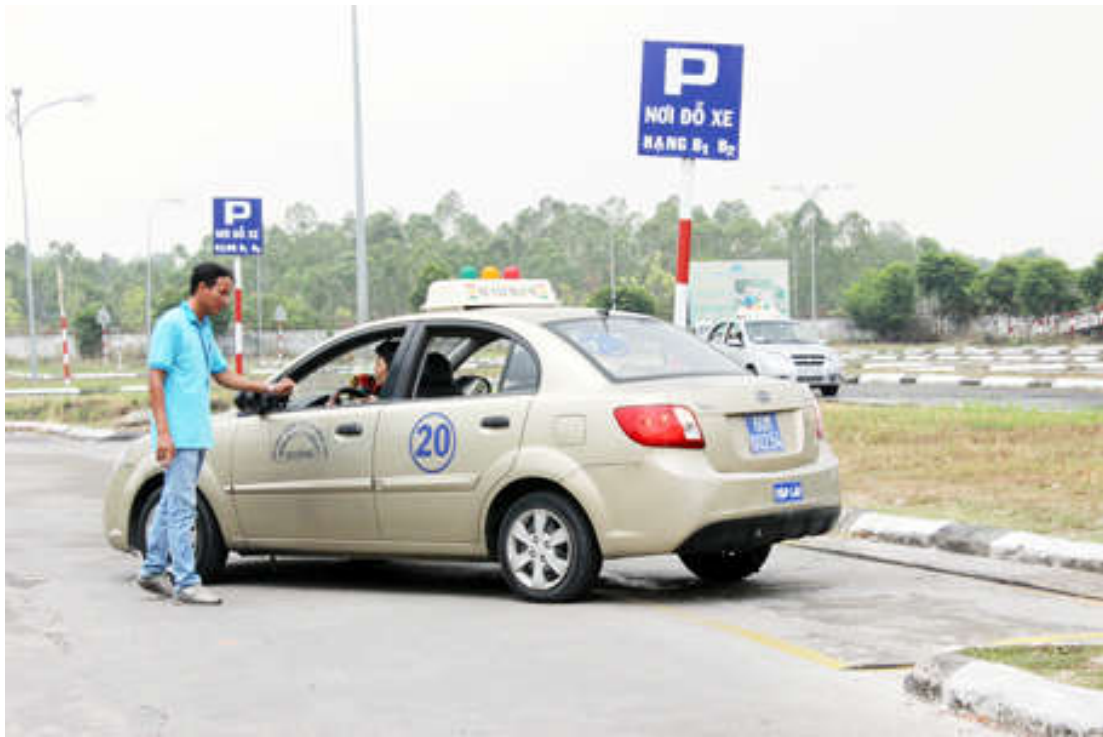
Người học lái xe thực hành tại Trung tâm đào tạo, sát hạch lái xe Đông Nai.

- GPLX quốc tế là giấy phép do cơ quan nhà nước có thẩm quyền của các nước tham gia Công ước về giao thông đường bộ năm 1968 (gọi tắt là Công ước 1968) cấp theo một mẫu thống nhất. Người có GPLX quốc tế có thể sử dụng để điều khiển phương tiện tại các nước có tham gia Công ước 1968.