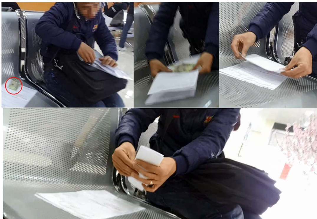
Một quy trình gấp tiền đầy đủ để chuẩn bị “bôi trơn”.