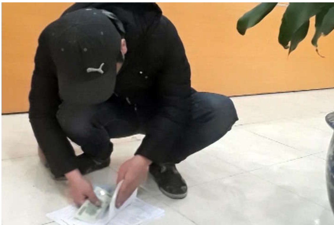
Để dàng để quan sát cảnh gấp tiền tại đây.

Không khó để chứng kiến cảnh “bôi trơn” khá nhộn nhịp tại Chi cục Hải quan Đình Vũ. Theo quan sát, có 2 khâu mà 100% cánh “chạy lệnh” đều phải “xì” tiền ra, là: Nộp lệ phí Hải quan và nộp Tiếp nhận Hải quan. Nếu như khâu Lệ phí Hải quan, tờ tiền sẽ được kẹp nhẹ nhàng vào bộ tờ khai để tuồn vào trong thì khâu ở Tiếp nhận, tờ tiền sẽ được bọc gói và kẹp gim cẩn thận hơn. Tất nhiên, trong cả 2 khâu, không chỉ “chạy lệnh” viên thân nhiên, mà cả cán bộ hải quan phụ trách cũng đưa tay nhận bộ tờ khai (có tiền kẹp bên trong) rất nhanh gọn. Hầu như không thấy thắc mắc, cựa cãi giữa các bên.