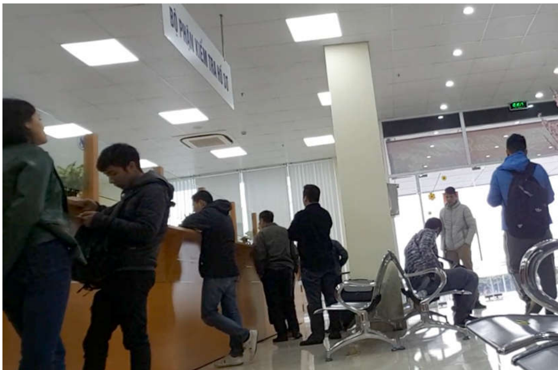
Nhân viên “chạy lệnh” tập trung tập nập ở Chi cục Hải quan Đình Vũ.

Chi cục Hải quan Đình Vũ là 1 tòa nhà bê thế nằm trong khu vực cảng Nam Hải - Đình Vũ với sảnh tầng 1 rất rộng. Các công chức hải quan