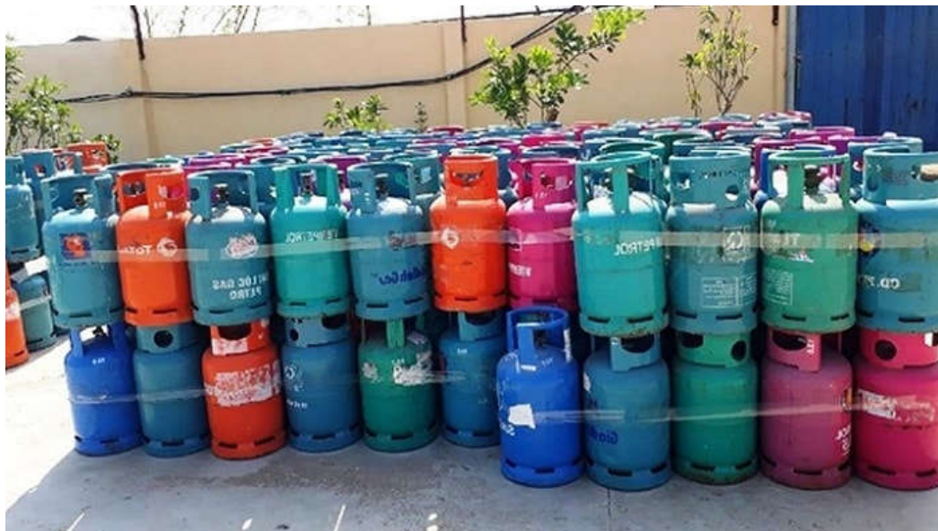
Tăng cường kiểm tra kinh doanh gas.

mà chủ yếu hàng hóa được các doanh nghiệp nhập từ các doanh nghiệp đầu mối kinh doanh LPG.