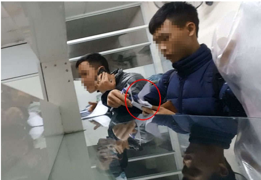
Các “chạy lệnh” viên đang làm thủ tục thông quan cho hàng hóa.

Theo số liệu thống kê chưa đầy đủ, tại Hải Phòng, hiện có hơn 300 doanh nghiệp chuyên cung cấp dịch vụ khai thuê hải quan, cùng với đó là hàng ngàn nhân viên “chạy lệnh”. Đa phần họ còn trẻ, là nam giới, hoạt bát, nhanh nhẹn và hiểu biết. Hằng ngày, từ trụ sở các công ty, họ tụ về 4 Chi cục Hải quan lớn của Hải Phòng để “chạy lệnh”. Sau đó, tùy vị trí xuống hàng, họ xuống gần biển hơn, ngược xuôi giữa hệ thống 14 cảng và 21 kho (bãi hạ) để tiếp tục công việc của mình.